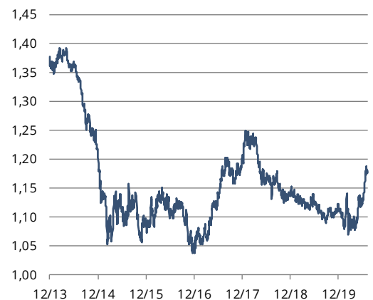
EUR/USD-Entwicklung (Grafik 1)

Zu Grafik 1 und 2: Die Angaben basieren auf Vergangenheitswerten. Die Wertentwicklung in der Vergangenheit lässt keine verlässlichen Rückschlüsse auf die zukünftige Entwicklung zu. Stand: 13.08.2020