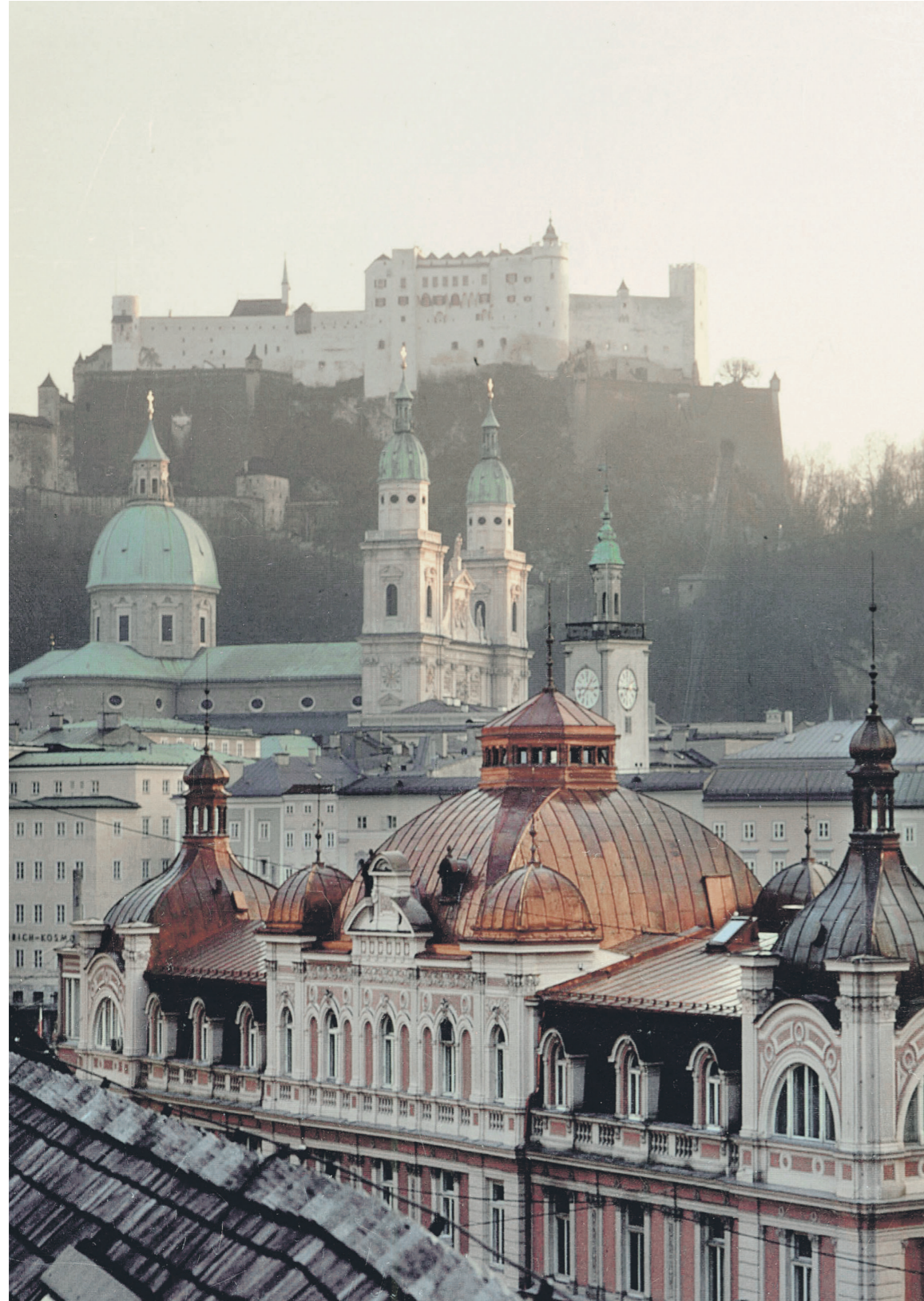
Das Bankhaus Spängler ist mit neun Standorten und insgesamt rund 260 Mitarbeitern in Stadt und Land Salzburg, Linz, Wien, Graz, Innsbruck und Kitzbühel vertreten. Direkt an der Staatsbrücke in der Stadt Salzburg befindet sich das Stammhaus des Bankhaus Spängler.